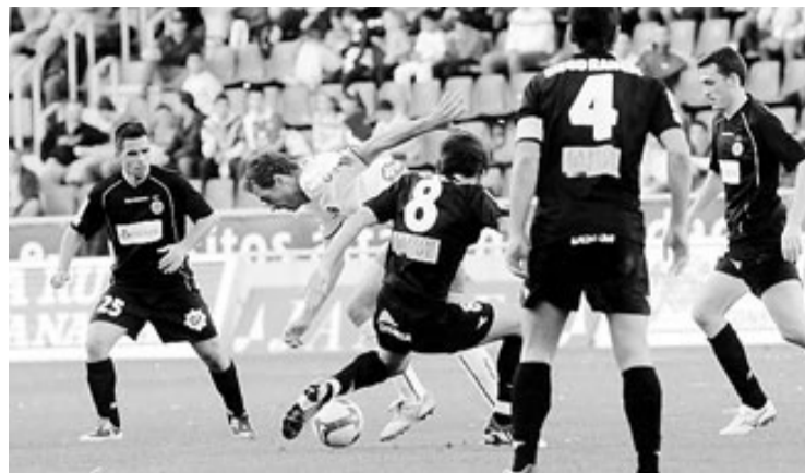
Els jugadors del Girona n'envolten un del Tenerife, ahir.

Abans de visitar el Castelló i l'Elx, la plantilla del Nàstic va recordar que les derrotes més dolores de la temporada passada van ser, precisament, la del Castàlia (3-1) i la del Martínez Valero (2-0), i que ara que tornaven a jugar contra aquests dos equips tenien moltes ganes de treure's les espines que duien clavades des de llavors. Després dels dos partits, però, els grana no s'han pogut rescabalar d'aquelles dues garrotades ja que, com la temporada passada, han perdut clarament contra el Castelló i l'Elx.